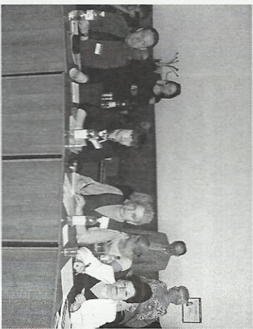
Робочі моменти семінару, 25-27 квітня 2012 р. м. Київ